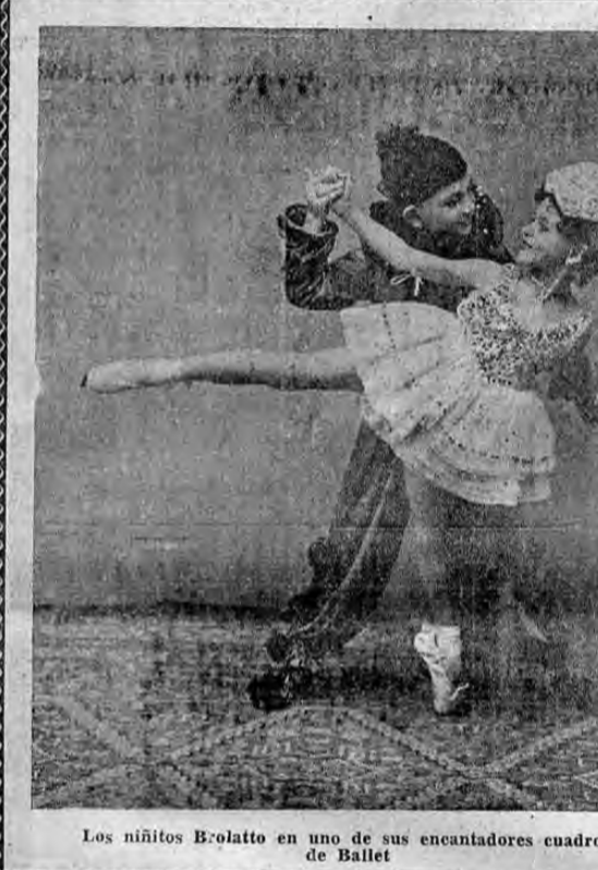
Los niños Brolatto en uno de sus encantadores cuadros de Ballet

Concurra a la FERIA y VELADA y ayude en esta forma al desarrollo de las nobles actividades de ACCION CATOLICA