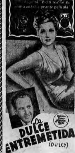
La DULCE ENTREMETIDA (Dulcy)

Otros dos Henazos de la Compañía de risa: TANGO LORCA. Tandas a las 7 y 9 p. m. Entrada ₡ 0.50 Estreno de la Astracanada Estreno de las carcajadas! Igual programa en las dos funciones!